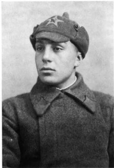
Красноармеец (1940 г.)