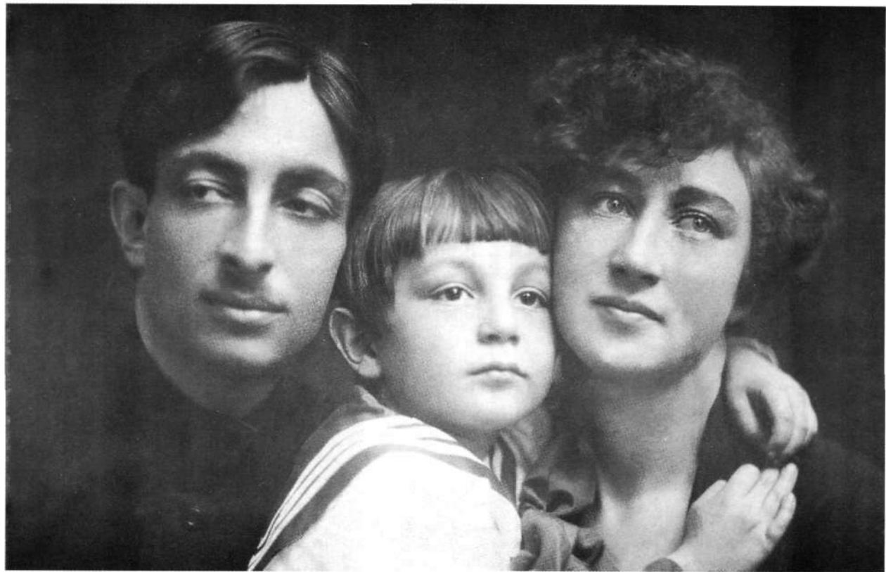
Отец и мать, Всеволоду 5 лет (1927 г.)