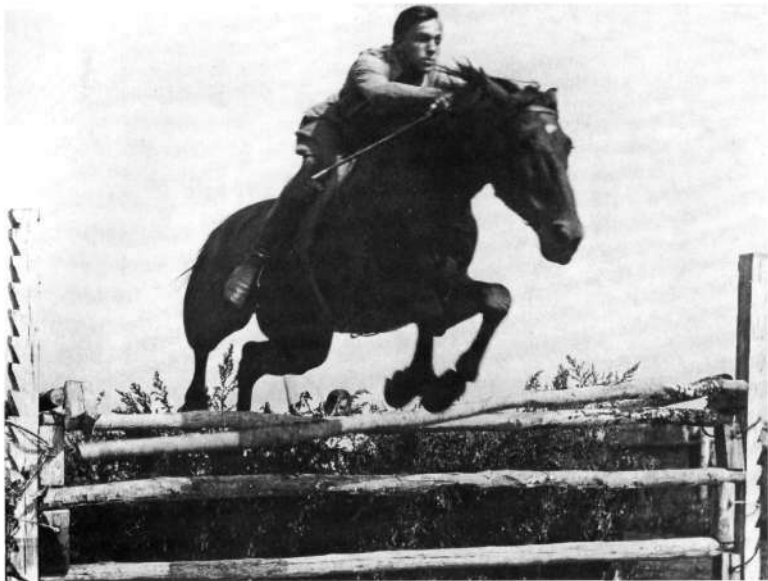
Первое препятствие взято (1935 г.)