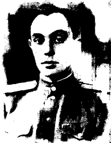
Штабной офицер (1944 г.)