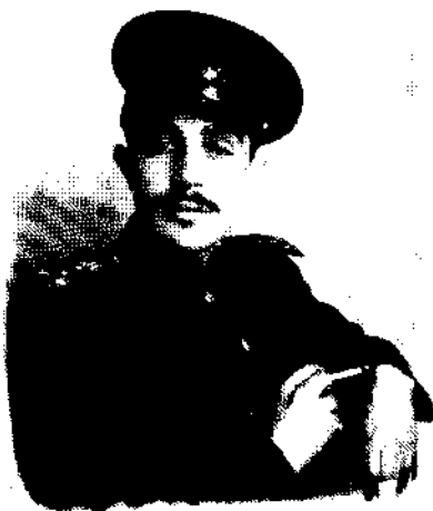
Офицер казачьего полка (1946 г.)