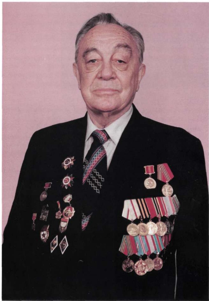
Ветеран (1999 г.)