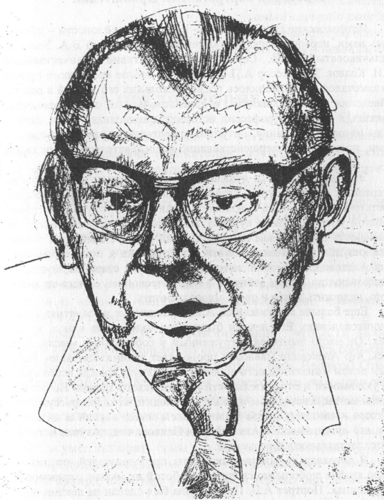
Александр Павлович Пронштейн (Рис. О. Морозовой, 1980 г.)