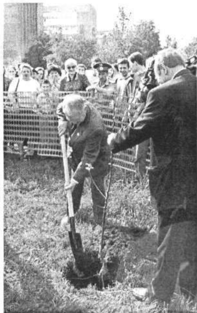
2001 г. Первое дерево в честь новой традиции – «Дня выпускника РГУ»

– Мой учитель жизни – университет. Коллеги, товарищи по работе, науке, образованию – все мои учителя. И я им обязан тем, что они передали мне и свой опыт, и знания, и свое видение мира и понимание науки, активность.