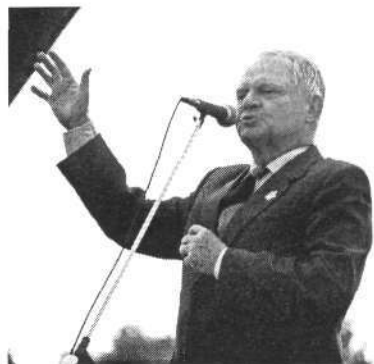
На празднике «День выпускника РГУ»

– Десятки тысяч выпускников РГУ называют Вас своим Учителем, а кто учил жизни Вас?