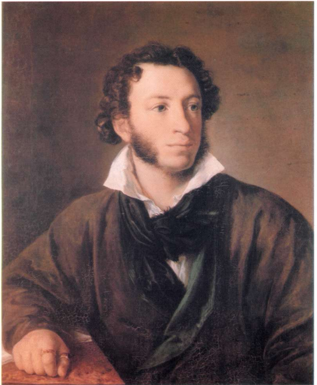
А. С. Пушкин Художник В. А. Тропинин. 1827