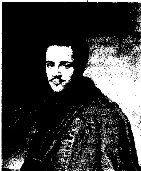
Н. Н. Раевский-младший Неизвестный художник. 1821

Мы в жизни розно шли: в объятиях покоя Едва, едва расцвел и вслед отца-героя В поля кровавые, под тучи вражьих стрел, Младенец избранный, ты гордо полетел.