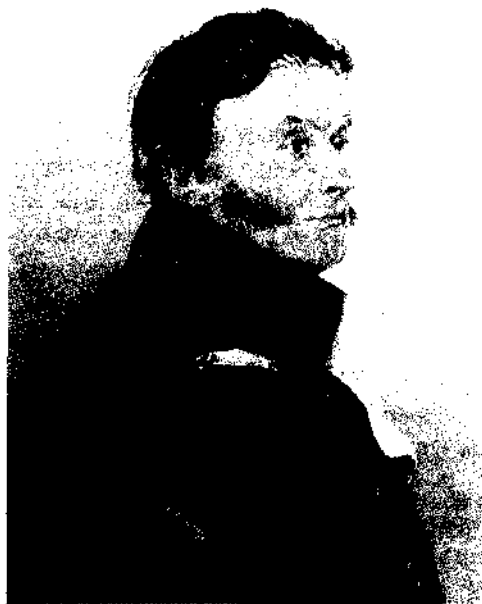
Н. Н. Раевский-старший Художник П. Ф. Соколов. 1826

В мае 1820 года семья Раевских, знакомая Пушкину по Петербургу, навестила заболевшего поэта в Екатеринославе и, с разрешения И. Н. Инзова, взяла его с собой на Кавказские минеральные воды. Отсюда они направились в Крым. «Мой друг, счастливейшие минуты жизни моей провел я посреди семейства почтенного Раевского, — писал вскоре Пушкин бра-