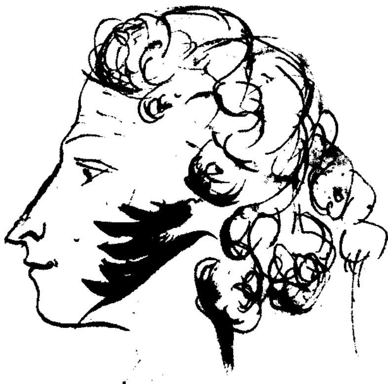
I.1-24. Автопортрет в образе поэта чернила на отдельном листе, вклеенном в альбом 1829