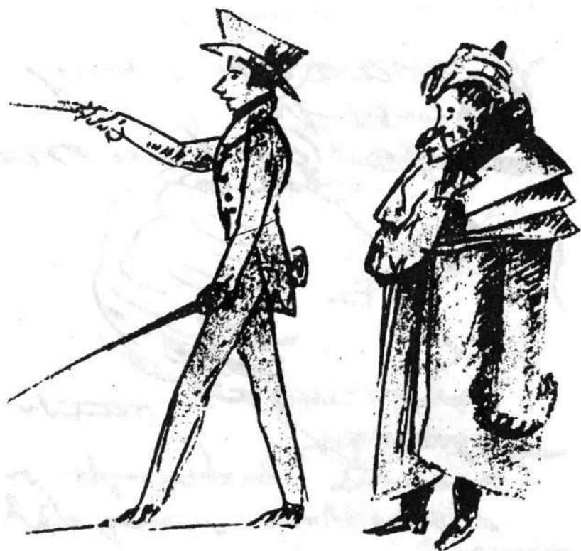
В.К. Кюхельбекер и К.Ф. Рылев на Сенатской площади