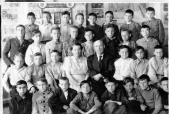
Мой единственный, озорной, любимый 5 класс