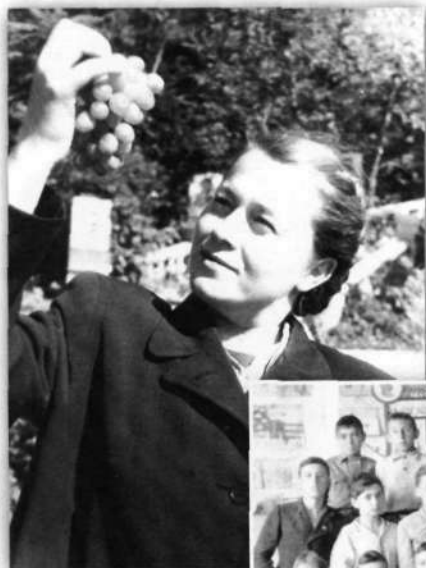
В саду. Я с виноградом