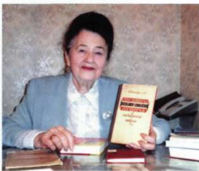
Я - автор