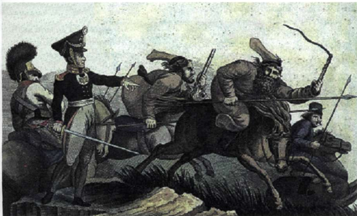
Казачи, летящие на тревогу. 1813