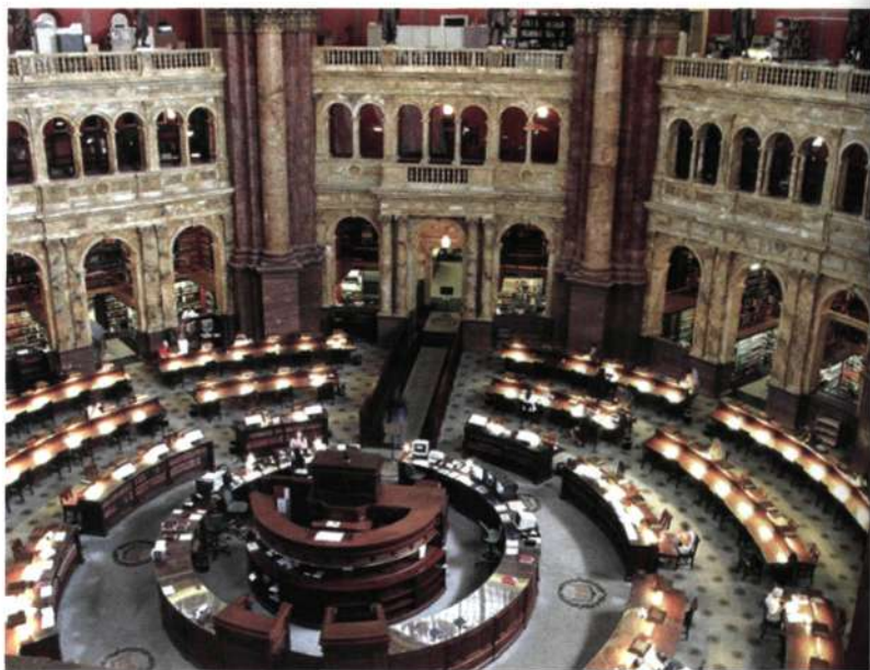
Читальный зал библиотеки Конгресса

на себя лишние заботы по обслуживанию копировального сервиса. В таких случаях эту работу можно передать на аутсорсинг. Например, компания Eastern Copy Products имеет клиентскую базу из более чем 700 публичных и академических библиотек, а также других учреждений. Суть услуги — установка копировальных аппаратов и устройств по выдаче карточек на территории библиотек. Программа под названием Vend-A-Copy позволяет библиотекам предлагать своим читателям услуги по копированию, однако без организационных хлопот. В обмен они получают от обслуживающей их компании процент от суммы, полученной за копирование на установленных на территории библиотеки машин.