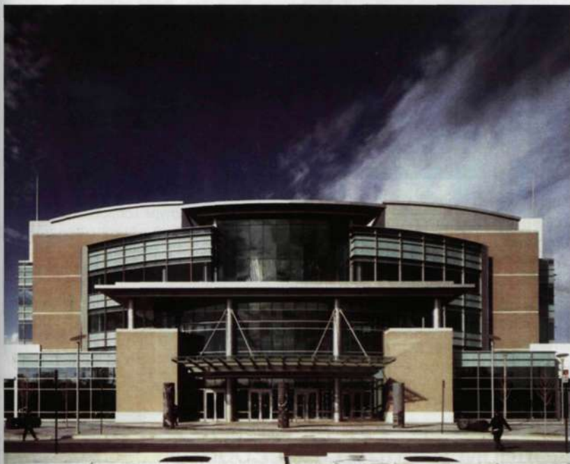
Здание Центральной публичной библиотеки Мемфиса

Другой вариант, который особенно популярен среди академических библиотек, представляет собой систему, при которой обслуживание копирующих машин, принтеров и вендинговых машин передается внешней компании. Например, копирующие центры при библиотеках Нью-Йоркской правовой школы, Сиракузского университета и других обслуживаются компанией Forrest Solutions, которая специализируется на обслуживании печатно-копирующей техники и вендинговой техники.