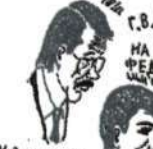
К. Смирнин: А мне что вала? ?