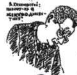
В. Кривошеин: много в истории истории?