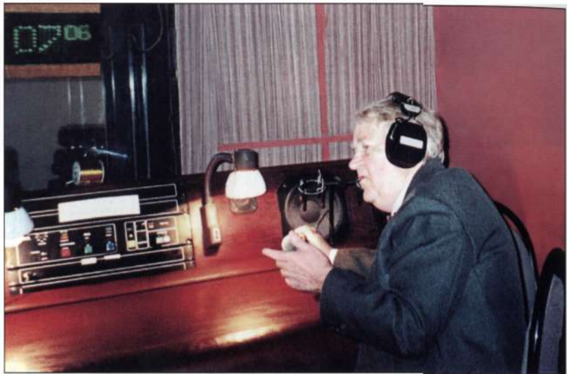
В радиостудии «Дон-ТР». 2005 г.