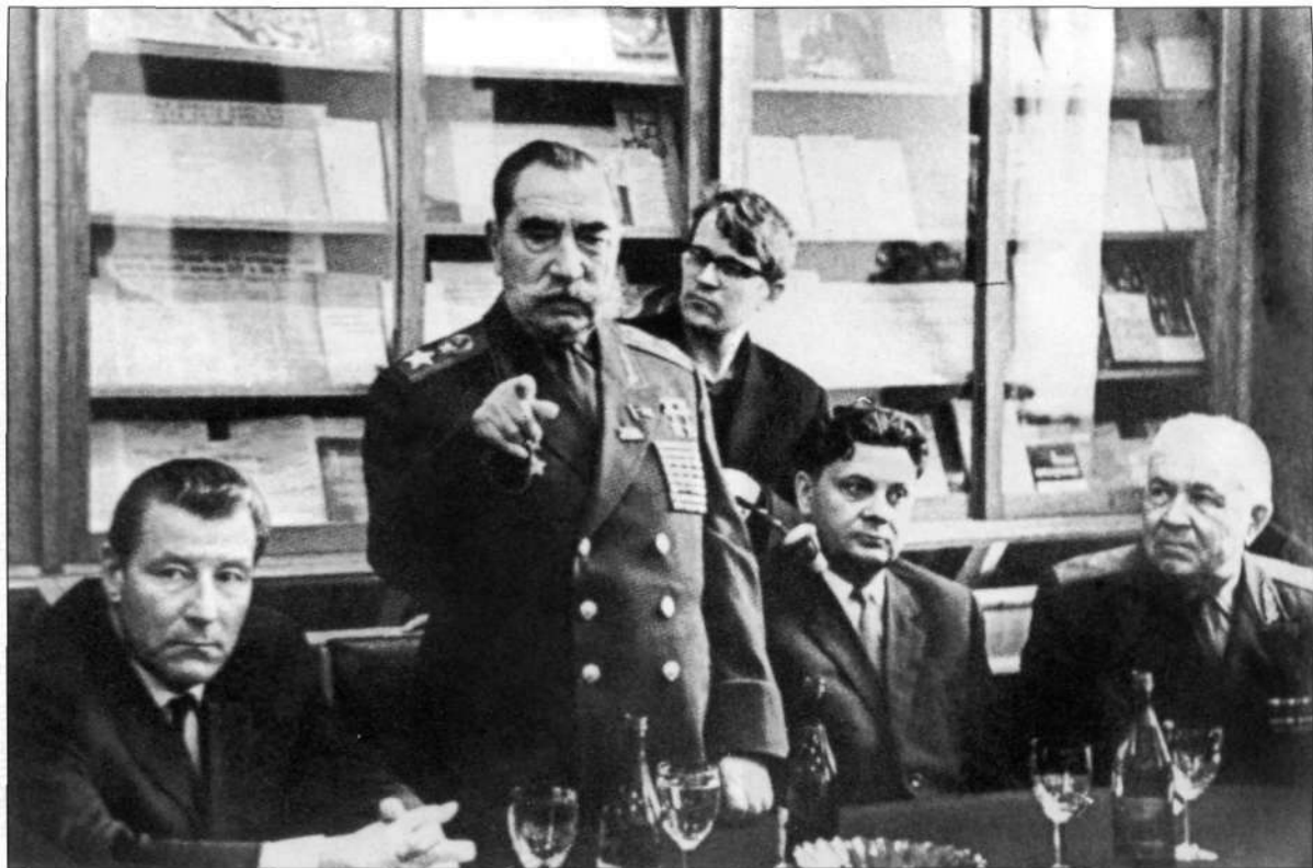
Корреспондент Ростовского радио. 1966 г. М.С. Соломенцев – 1-й секретарь Ростовского обкома КПСС, С.М. Буденный – Маршал СССР, И.А. Бондаренко – председатель облисполкома, Д.М. Рябышев – генерал